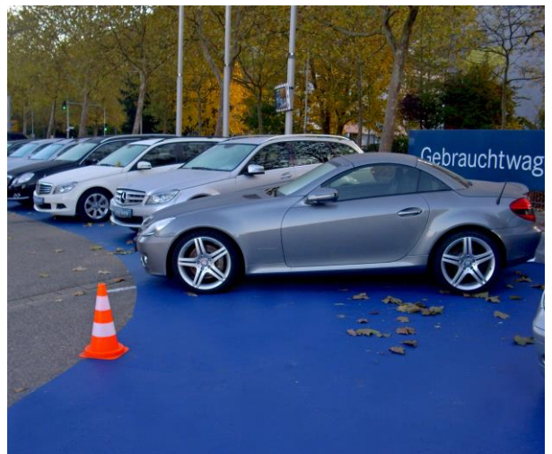
Applikation-Beispiele - Die ersten drei Fotos: DecoMark® Symbole auf PlastiRoute® RollPlast® 9017 Verkehrsschwarz ; unten rechts PlastiRoute® RollPlast® Mercedes Blau für einen Outdoor Showroom.